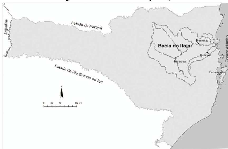
Figura 2 – Bacia do Rio Itajaí-Açu