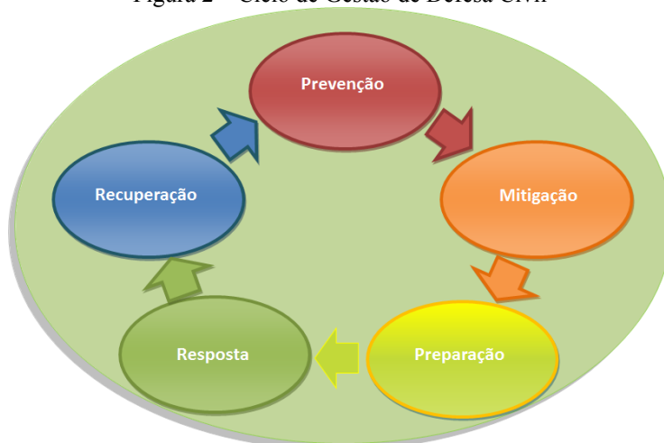
Figura 2 – Ciclo de Gestão de Defesa Civil