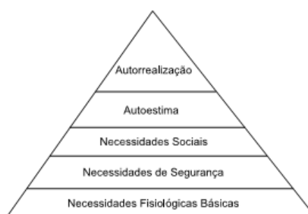
Figura 1 – Pirâmide das necessidades de Maslow

A teoria da hierarquia das necessidades, também denominada como a teoria das necessidades humanas, foi desenvolvida pelo psicólogo Abraham H. Maslow, e é considerada a teoria mais conhecida sobre motivação. (CHIAVENATO, 2010), pois classifica as necessidades humanas de forma lógica e conveniente, com pressuposições importantes para os administradores. Foi na década de 50 que Maslow desenvolveu um modelo teórico que explicasse as necessidades humanas e sua disposição, distribuído em cinco hierarquias: fisiológicas, segurança, sociais, estima e autorrealização, conforme a figura 1: